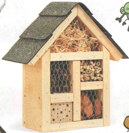
04 Bausatz Insektenhotel